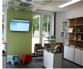
Tourist-Information Bad Lippspringe