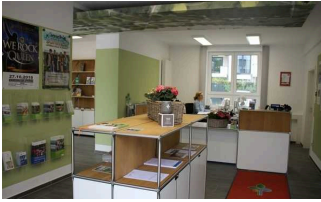
Tourist-Information Bad Lippspringe