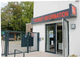
Tourist-Information Bad Lippspringe