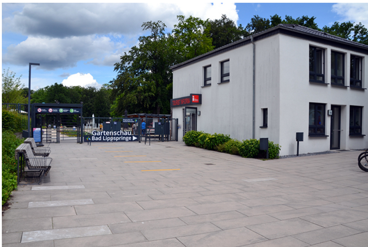
Tourist-Information Bad Lippspringe