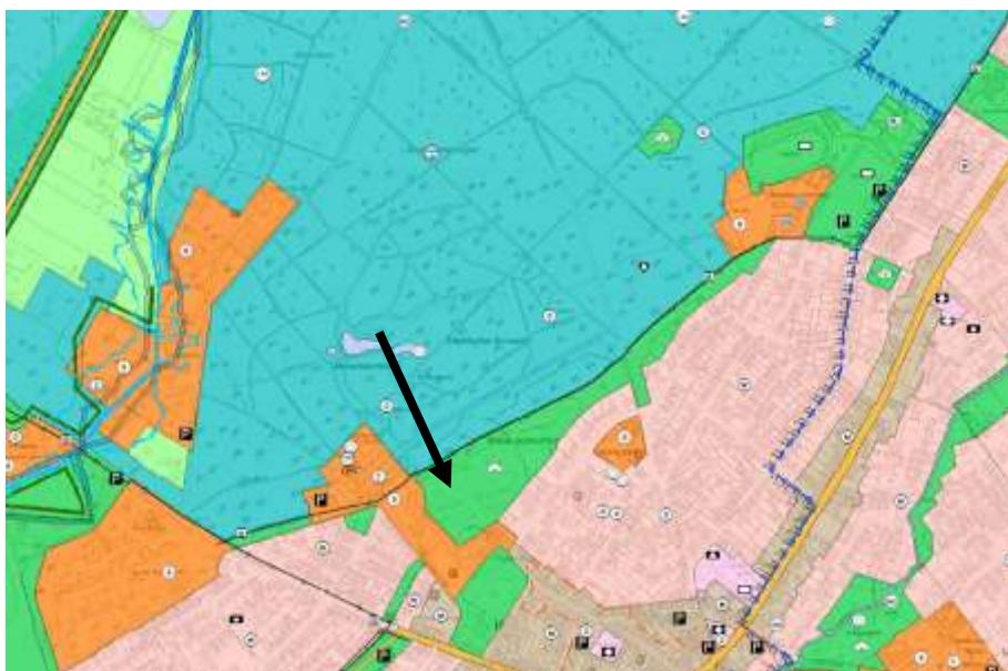
Auszug aus dem rechtswirksamen FNP

Der östliche Bereich entlang der Wohnbebauung ist als Grünfläche gem.§5 (2) Nr.5 BauGB mit der Zweckbestimmung Parkanlage (Kaiser-Karls-Park) dargestellt. Für den Bereich der Klinik Martinusquelle und des Bereichs des Parkhotels sieht der Flächennutzungsplan Sondergebiete gem. §5 (2) Nr. 1 BauGB vor. Zudem befinden sich zwei Denkmale, eine Altlast und eine unterirdische Gasleitung im Gebiet.