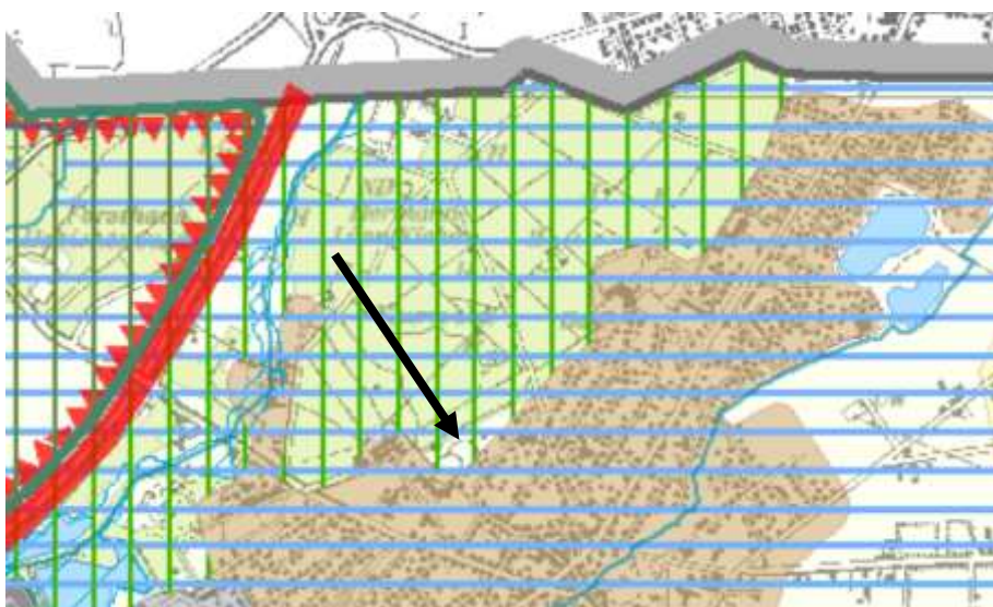
Ausschnitt aus dem gültigen Regionalplan Teilabschnitt Paderborn Höxter (ohne Maßstab)

Der Regionalplan stellt im Bereich des Bebauungsplans „Waldbereiche“, „Schutz der Landschaft und landschaftsorientierte Erholung“ als auch „Grundwasser und Gewässerschutz“ dar. Die drei Darstellungen überlagern sich und gelten fast für den gesamten Planbereich. Die Klinik Martinusquelle und das Hotel sind als Allgemeine Siedlungsbereiche (ASB) dargestellt. Für diesen Bereich sind der Gewässerschutz sowie der Schutz der Landschaft dargestellt. Die konkrete Abgrenzung des Landschaftsschutzgebietes verläuft allerdings rund 20m nördlich der Wandelhalle.